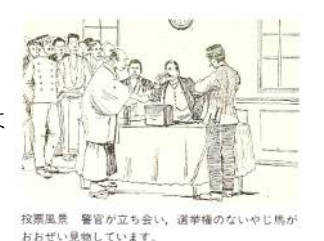
投票風景 警官が立ち会い、選挙権のないやじ馬がおおせい見物しています。

しかし、(69…地方名をあるだけ)に住む人々には選挙権がなく、選挙権があたえられたのは1900年と1912年のことです。