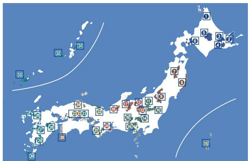
34 奄美群島国立公園

国立公園は国の役所の(22…?省)が指定して決めています。現在は全国で34か所の国立公園があります。火山と火山によってつくられた湖などの地形があり、たくさんの観光客がおとずれています。